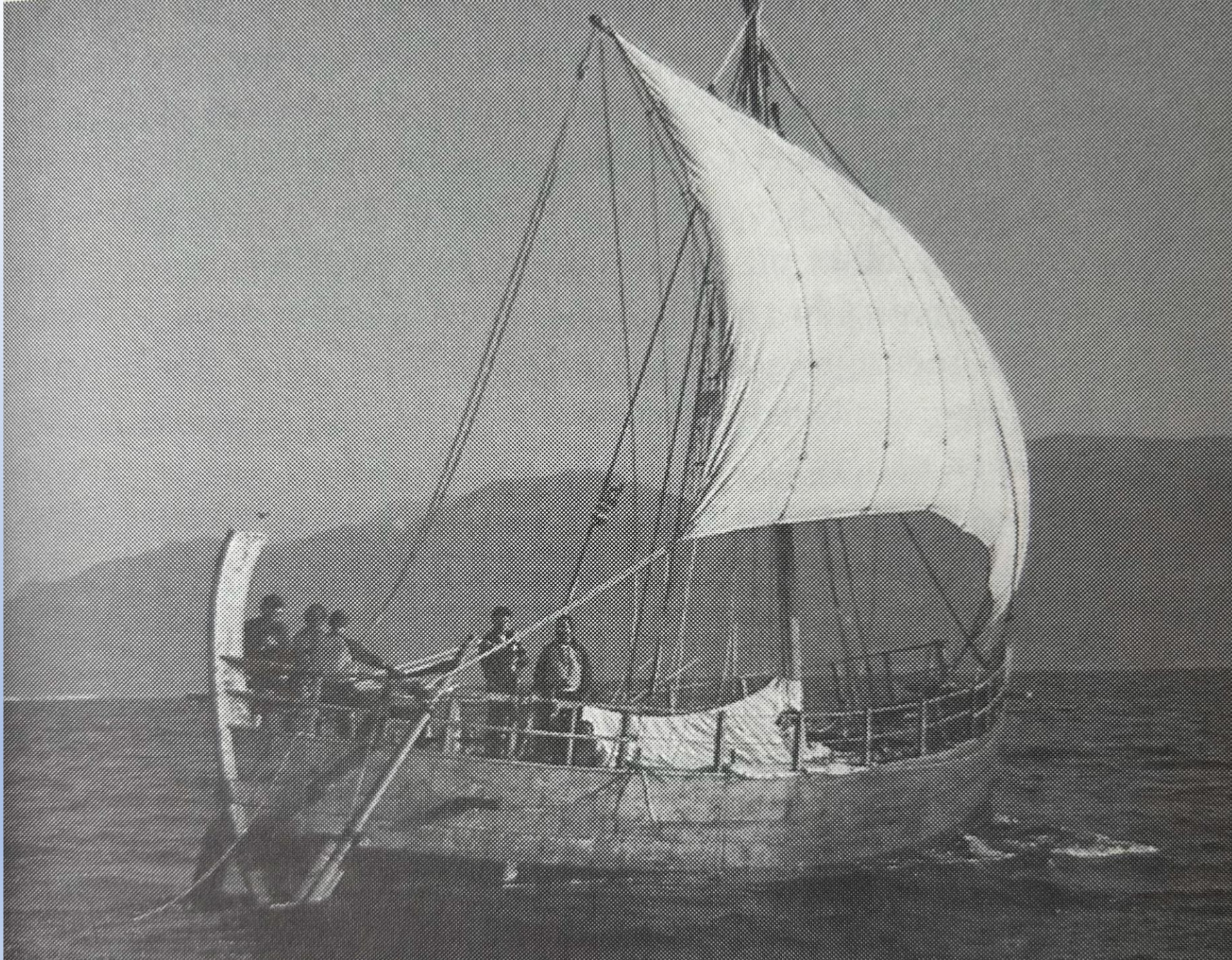
Het gereconstrueerde Kyrenia-schip